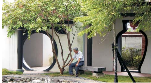
Lin An Tai: Garten-Architektur der Qing-Dynastie aus dem 18. Jh. in Taipei

Sauber wie Japan, locker wie Thailand - nach seiner enormen wirtschaftlichen Entwicklung, gehört Taiwan heute zu den Ländern mit dem höchsten Wohlstand. Der hohe Lebensstandard spiegelt sich in allen Bereichen wider: angefangen bei der hervorragenden Infrastruktur, über das Gesundheitswesen, bis hin zur vorbildlichen Bildungspolitik. Der unglaubliche Reichtum an chinesischen Kulturgütern und die teils atemberaubenden Landschaften dieser großen Insel lohnen auf jeden Fall die Anreise. Von den Portugiesen zu recht Ilha Formosa (die schöne Insel) genannt, lockt Taiwan bis heute mit einer einzigartigen subtropischen Vegetation. Der größte Teil der Insel wird durch Bergmassive mit fast 4000 m Höhe geprägt. Heiße Quellen deuten auf eine recht junge Entstehung - das Gebirge zählt zu den jüngsten weltweit. Ein