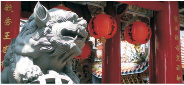
daoistischer Bishan-Tempel im Südosten von Taipei